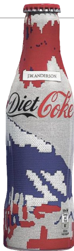
Prickelnd: Coca-Cola light, Flaschendesign von J.W. Anderson. Um 3 Euro bei Harveynichols.com