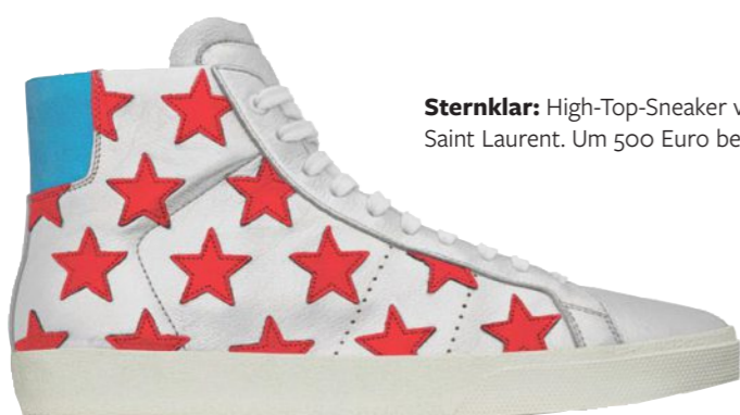
Sternklar: High-Top-Sneaker von Saint Laurent. Um 500 Euro bei Ysl.com