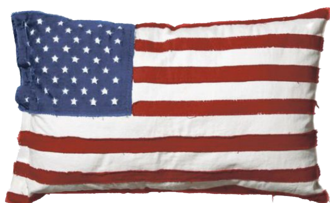
Ausgefranst: Patchworkkissen von Seletti. 36 Euro bei Yoox.com