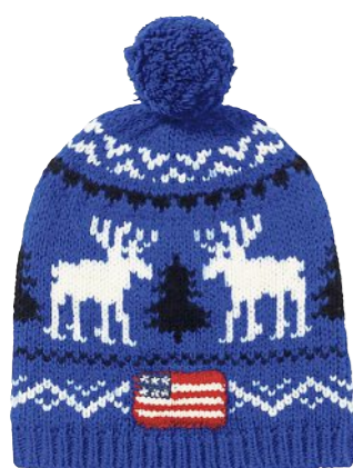
Weihnachtlich: Pudelmütze mit Rentiermotiv von Polo Ralph Lauren. Um 100 Euro bei Ralphlauren.de