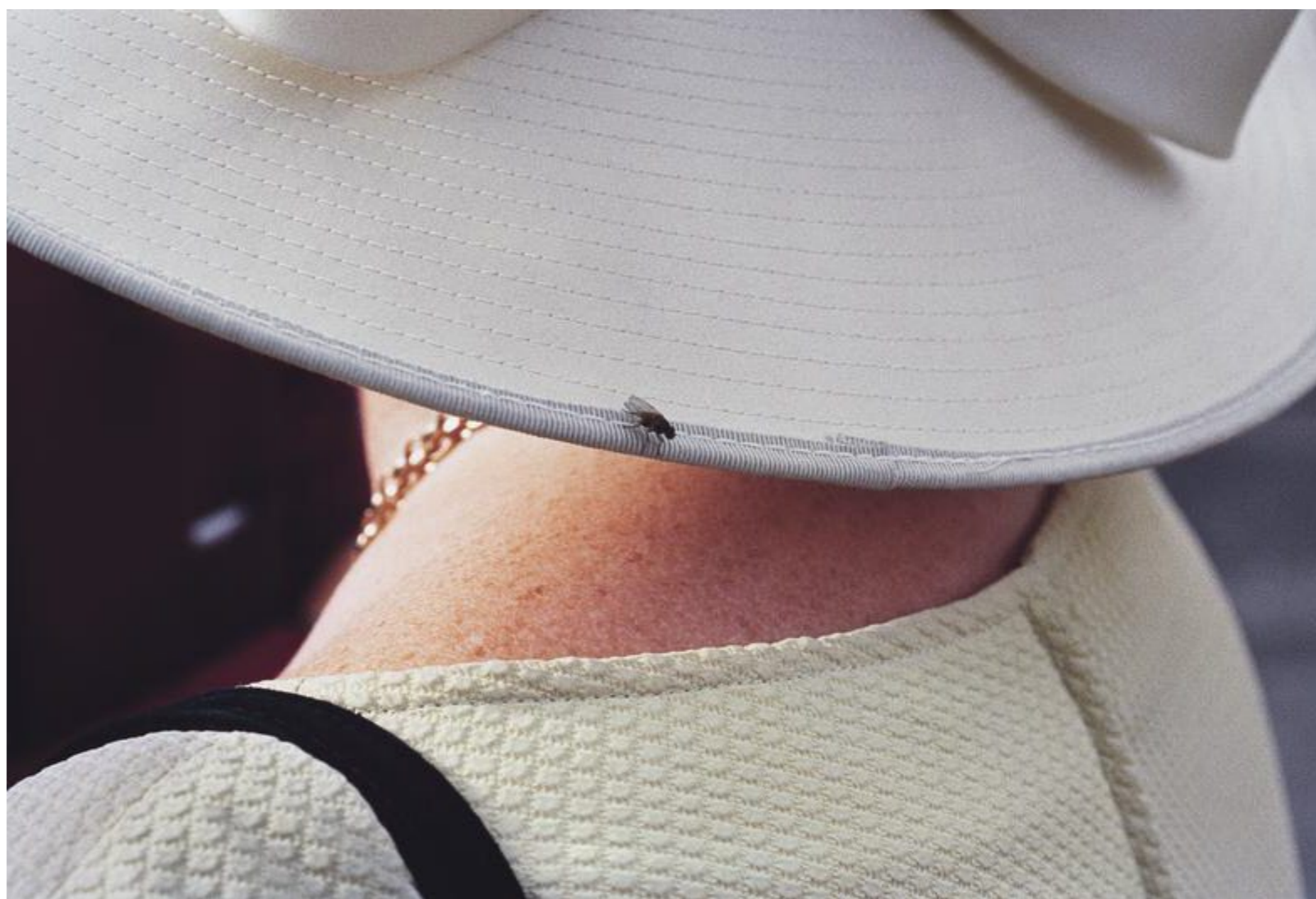
Auch das luxuriöse Leben hat seine Schattenseiten: So eine Fliege am maßgefertigten Hut kann einem den schönsten Tag an der Rennbahn vermiesen

Irgendwo in den Hamburger Elbvororten auf einer Geburtstagsfeier mit Buffet vom Cateringservice. Eine gepflegte Blondine rauscht hinein, sie braucht dringend einen Hendrick's-Tonic. „Dieser Stress.“ Da wäre die neue Reitbeteiligung der Tochter. „Ich soll das Pferd miterziehen, aber ich kann nicht mal richtig reiten.“ Außerdem hat der Sohn Geburtstag, er wünscht sich alle Wahrzeichen der Stadt in Schokolade gegossen. „Beim ersten Versuch ist gleich der Fernsehturm gebrochen.“ Noch was? „Und dann kommt auch noch zwei Tage lang der Baumhausbauer.“ Sagt's - und muss selbst lachen über das eigene Gejammer.