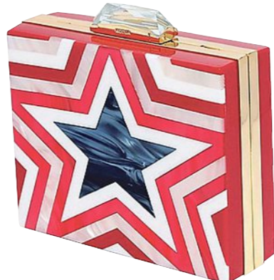
Discotauglich: Clutch aus Plexiglas von Kotur. Um 730 Euro bei Luisaviaroma.com